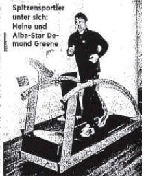
Heines Daten auf dem Computer verraten: Er ist fit wie ein Spieler